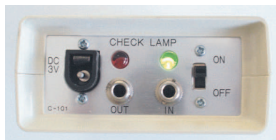
*ブザーとランプで設定値をお知らせ